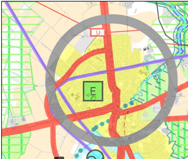
Abb. 1: Auszug aus dem Regionalen Raumordnungsprogramm 2020 Landkreis Rotenburg (Wümme), ohne Maßstab

Der östliche Teil des Änderungsgebiets wird als Teil des zentralen Siedlungsgebiets der Stadt Zeven dargestellt. Die Änderungsfläche liegt zudem im Randbereich eines großen Vorbehaltsgebiets für die Landwirtschaft aufgrund hohen Ertragspotenzials.